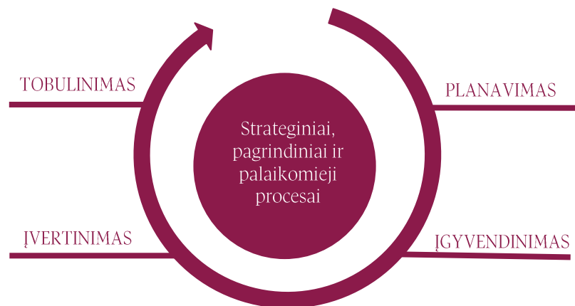
1. PAV. PDCA MODELIS UŽTIKRINANT VDU KOKYBĘ

Plėtojant kokybės užtikrinimą, laikomasi atvirumo tobulėjimui, kolegialumo, akademinės etikos, atsakomybės ir viešumo principų (2 pav.):