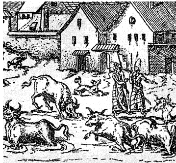
Illustration 8. Fragment of 1568 Grodno Panoramic Image Carving by Mathias Zündt Picturing a Crossbreed Watchdog

Schemes, diagrams, images and other illustrations shall be numbered in Arabic numerals. The number and title must be indicated below the scheme, diagram, image or other illustration on the right margin of the page, for instance: