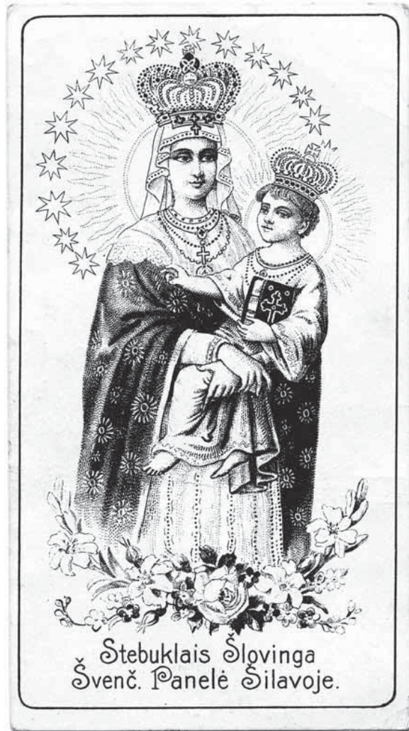
4 ir 5 pav. Leidėja Barbora Vizgirdaitė. Devociniai paveikslėliai. 1922 m. Privati nuosavybė.