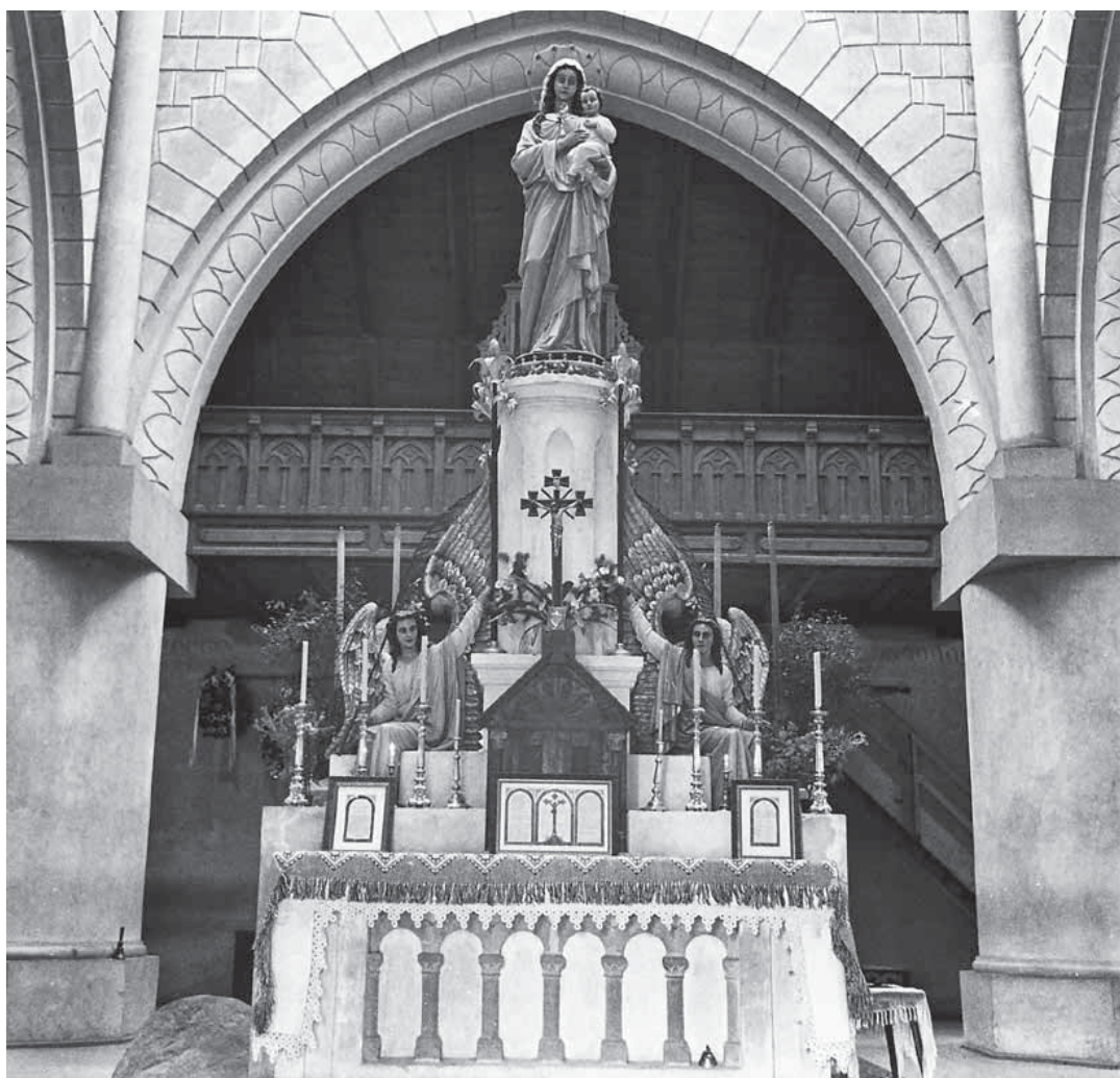
7 pav. Šiluvos Apsireiškimo koplyčios altorius. 1936 m.