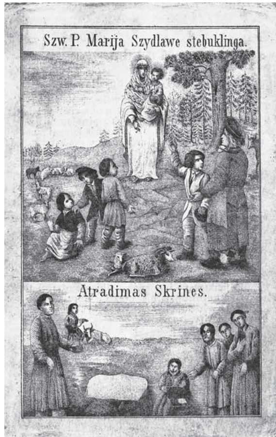
3 pav. Devocinis paveikslėlis. 1886 m. Privati nuosavybė.

Svarstytinios kelios kitokios ikonografijos, nei karūnuotojo Šiluvos paveikslų pasirinkimo priežastys. Viena jų: norėta sukurti kitokį Marijos su Jėzumi atvaizdą, kuris taptų šaukinio Ligonijų Sveikata sinonimu ir, kildamas virš apsišvieškimo akmenis, kada nors sulauktų pripažinimo, atskiros pagarbos. Bet tai tik prielaida, nes visai galima antra versija: architektas pateikė tik eskizinius skulptūrų apmatius, ir todėl jokių išvadų daryti nederėtų. Tačiau norėtųsi dar stabtelėti prie galimai naujo Marijos su Kūdikiu vaizdinio kūrimo versijos. XIX amžiuje, taigi dar gerokai iki koplyčios statybos pradžios, paplito graviūros ir daug jas imituojančių devocinių paveikslėlių, kuriuose Šiluvos Švč. Mergelės Marijos su Kūdikiu