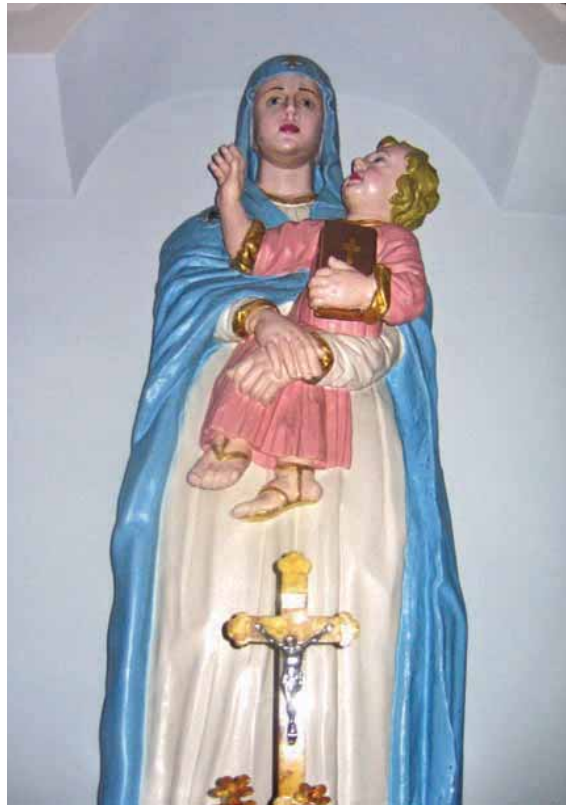
6 pav. Skulptūra Švč. Mergelė Marija su Kūdikiu, stovėjusi medinėje Šiluvos Apsireiškimo koplyčioje, o dabar esanti bažnyčios koplyčioje.