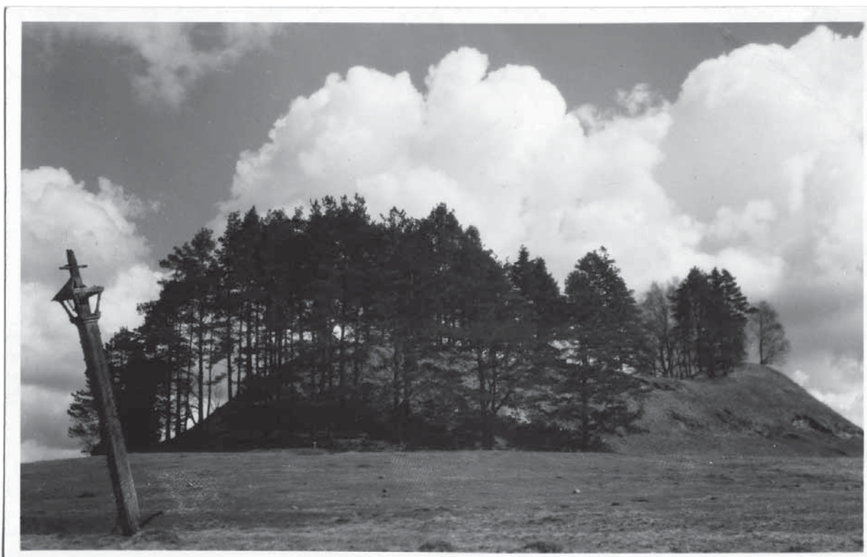
Bubių piliakalnis. Balio Buračo nuotrauka. 1936. MAB. F.235-43