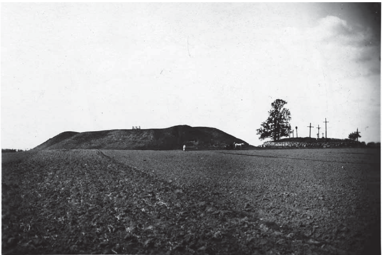
Peleniškių piliakalnis. Liudviko Kšivickio nuotrauka. 1910. MAB. F.235–241

Braižė Petras Tarasėna. MAB. F.235– 241. L.4