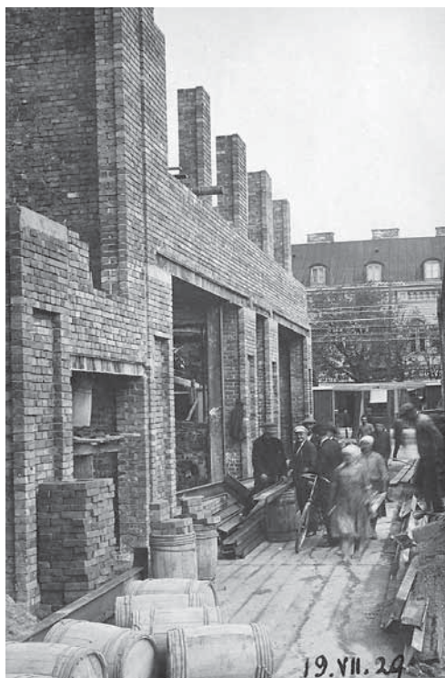
1 pav. Kinoteatro „Metropolitain“ ir baro „Pale Ale“ statyba Kaune. K. Dušauskas-Duž viduryje (su balta kepure).