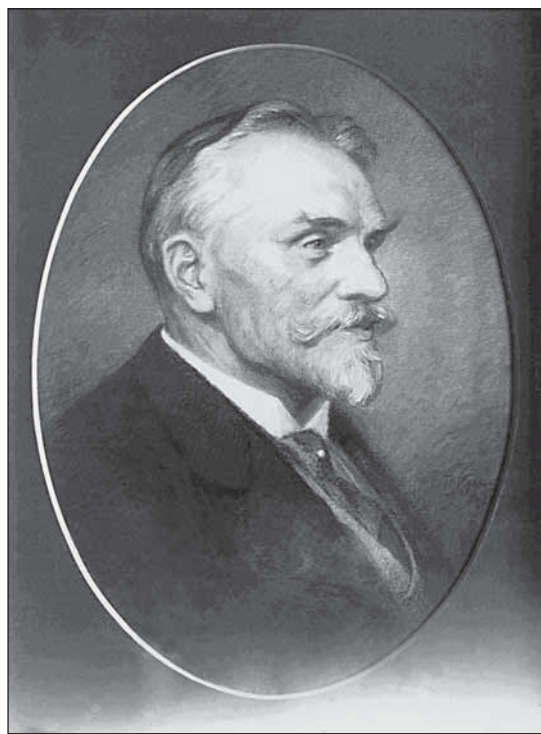
Теодор Карл Отто Краус. Портрет искусствоведа Вильгельма Неймана (Wilhelm Neumann, 1849–1919). Пастель.

Theodor Karl Otto Kraus, 1866–1948. Portrait of art historian Wilhelm Neumann. Pastel. Deutsches Dokumentationszentrum für Kunstgeschichte. Bildarchiv Foto Marburg