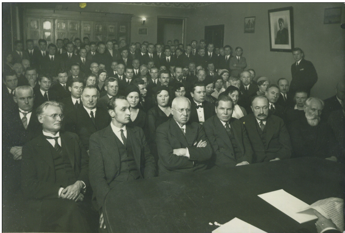
1 il. 4-ojo dešimtmečio pirmoje pusėje vykusiame LVLS visuotiniame metiniame atstovų suvažiavime Justas Paleckis (antras iš kairės) sėdi pirmoje eilėje greta senųjų valstiečių liaudininkų lyderių Kazio Griniaus (pirmas iš kairės) ir Mykolo Sleževičiaus (penktas iš kairės).