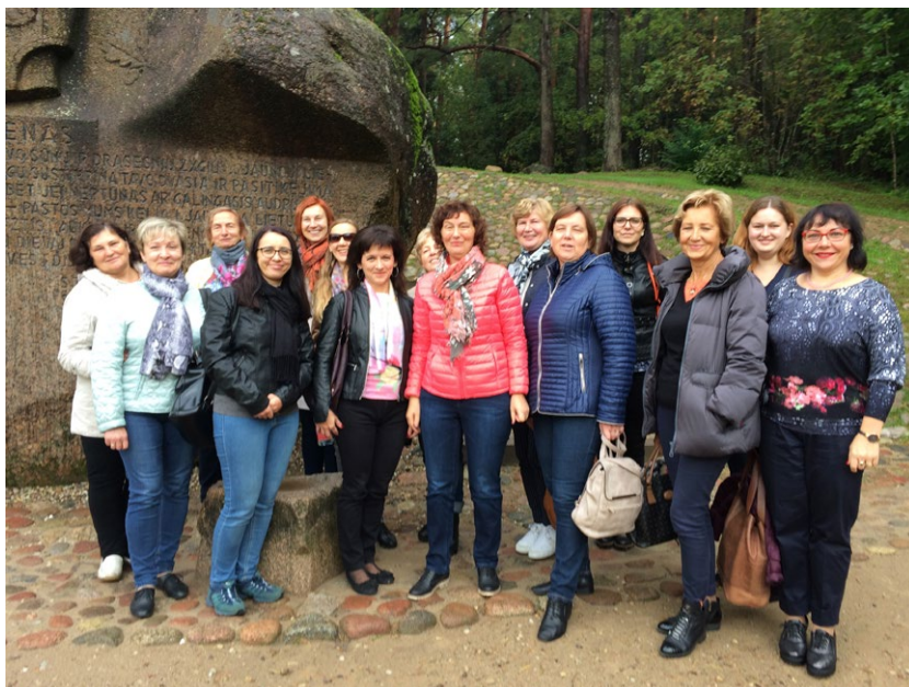
Instituto kolektyvas prie Puntuko akmens Anykščiuose 2017 m.