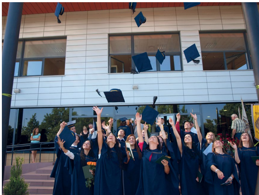
Diplomų įteikimo šventė 2013 m.

70 proc. absolventų. Šios programos studijų vienas ypatumų yra tai, kad labai daug studentų, pasibaigus profesinės veiklos praktikai, kurią jie atlieka trečio kurso pabaigoje, lieka dirbti tose pačiose organizacijose. 60–70 proc. įsidarbinimo lygis būdingas ir Kaimo plėtros administravimo bakalauro bei magistrantūros studijų programoms. Taigi, Fakultete vykdomos studijų programos yra populiarios, o jų absolventai – paklausūs darbo rinkoje.