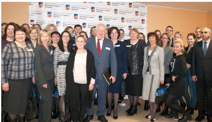
Tarptautinės mokslinės konferencijos „Apskaita ir finansai: mokslo ir verslo partnerystė“ dalyviai 2016 m.