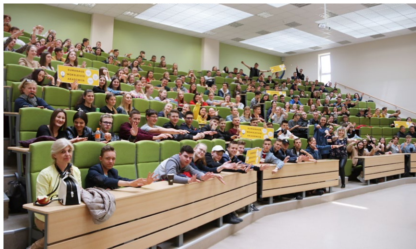
Sumanaus moksleivio akademija, 2018–2019 m. m. Sumanaus moksleivio akademijos dalyviai su Verslumo ugdymo centro komanda

Sulaukus didelio moksleivio susidomėjimo ir matant poreikį plėsti SMA veiklos sritis, 2018 m. buvo organizuojama atnaujinta Sumanaus moksleivio akademija, kurioje moksleiviai galėjo rinktis iš trijų skirtingų mokslo krypčių