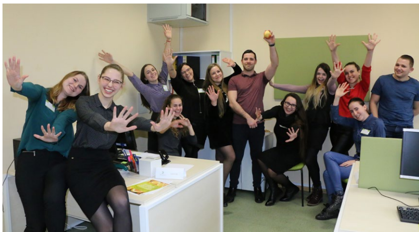
Verislumo ugdymo praktika, 2018 m. Logistikos ir prekybos studijų programos studentai

verslo praktinio mokymo įmonėje (IVPMĮ). Praktikos metu sprendžiami verslo planavimo, organizavimo, kontrolės, vadovavimo ir įmonės veiklos vertinimo uždaviniai. IVPMĮ Agroverslo korporacija, turinti tris antrines įmones: „Agro-line“ (lioofilizuotų vaisių gamyba ir prekyba), „Eco-pack“ (ekologiškos taros gamyba ir prekyba) ir „Litvega1“ (vaisių ir daržovių traškučių gamyba ir prekyba) įkurta ir Lietuvos verslo praktinio mokymo įmonių tinklo „Simulith“ registre įregistruota Universitete vykdomo projekto „Organizacinių ir metodinių sąlygų studentų verslumo gebėjimams ugdyti sukūrimas, naudojant verslo praktinio mokymo modelį“ metu. 2012 m. IVPMĮ Agroverslo korporacija sėkmingai pristatyta tarptautinėje arenoje, jos veiklą įvertinta ir nacionaliniu mastu. 2014 m. ASU Ekonomikos ir vadybos fakultete Verslumo ugdymo centro ir „Simulith“ iniciatyva buvo organizuota 18-oji tarptautinė verslo praktinio mokymo įmonių mugė „Kaunas 2014“, kurioje dalyvavo daugiau kaip 50 įmonių. Joms atstovavo apie 250 moksleivių ir studentų iš Lietuvos ir užsienio šalių.