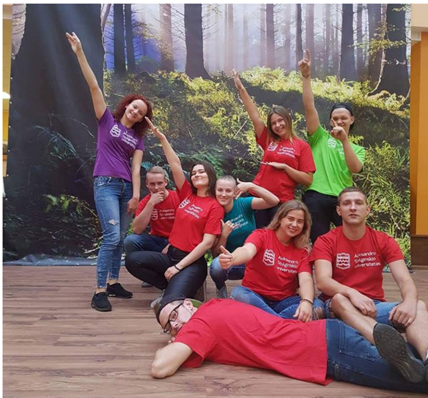
Jaunojo lyderio stovykla, 2018 m. Jaunojo lyderio stovyklos mentoriai – ASU studentų atstovybės nariai

save, išsikelti ateities tikslus ir mokėti priimti nesėkmes kaip gerą patirtį siekiant tikslų. Stovyklos programa parengta taip, kad kiekvienas moksleivis galėtų atsiskleisti kaip asmenybė, pažinti save komandinėse užduotyse, rasti vidinės stiprybės ir pripažinti savo gebėjimus. Stovykloje daugelis užduočių atliekamos lauke ir susipažįstama su Universiteto aplinka.