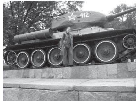
Rusijoje gausu savitų paminklų, skirtų Antrojo pasaulinio karo kovoms atminti: ant pjedestalo užkeliama mūsų šiuose išlikusi karinė technika

Na, bet pats traukinys ir aptarnavimas mane tikrai sužavėjo ir po penkių valandų aš jau pasiekiau tikslą. Nižnij Novgorodo širdis taip pat yra Kremlius (kremlius – tai viduramžių gynybinis statinys, dažniausiai statomas ant plokščiakalnio). Nižnij Novgorodo Kremlius – gal ne toks garsus kaip Maskvos, bet iki šiol išlikęs ir veikiantis.