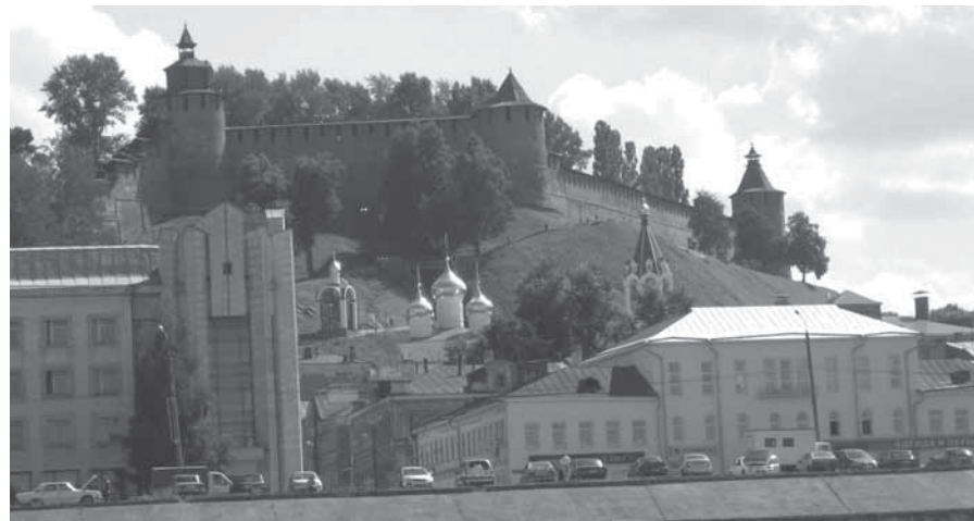
Nižnij Novgorodo Kremlius – tai ant kalvos esantis viduramžių gynybinis statinys