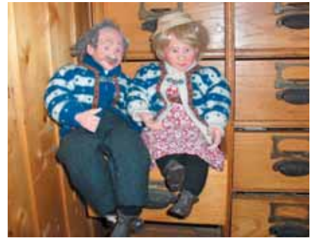
Šios lėlytės, vaizduojančios pagyvenusių norvegų porą, aprengtos tradiciniais norvegiškais megztiniais, kuriuos dažnai įsigyja turistai

Visgi žmonės nėra labai nemalonūs, mėgsta paplepti, o ypač apie kaimynus ir draugus. Toks artimas lietuvių širdžiai pavydas ir čia sutinkamas, o tai irgi padeda adaptuotis atvykėliams. Teko įsitikinti, kad tokie pomėgiai, kaip intrigų rezgimas ir stebėjimasis kitų suregztomis intrigomis, labai suartina tautas. Kuo įdomesnė tavo intriga, tuo labiau laukiamas tampa įvairiuose lizduose (taip vadinami namai, kuriuose vienu