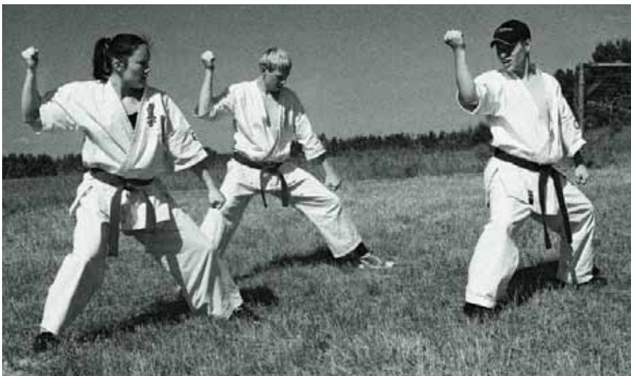
Treniruotės – karatistų kasdienybė

Stovyklautojai skųsdavosi, kad kartais kildavo problemų dėl maudynių. Mat ežero