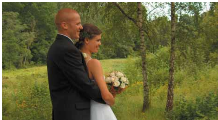
Nors visos pašnekovės sutiko, kad vestuvės – tai svarbus aktas, tačiau taip pat tvirtino, kad po jų gyvenimas beveik nepasikeičia