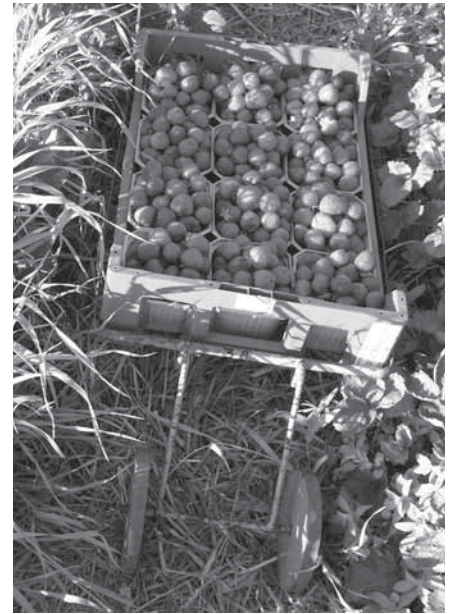
Braškių lauke Giedrė sutiko dėstytoją vokiečių, kuris, vasarą tarypdamas dėzes su uogomis, šitaip ilsina smegenis

Bendraujate labai draugiškai ir paprastai. O kokia atmosfera vyrauja dėstytojų bei studentų tarpusavio ben-