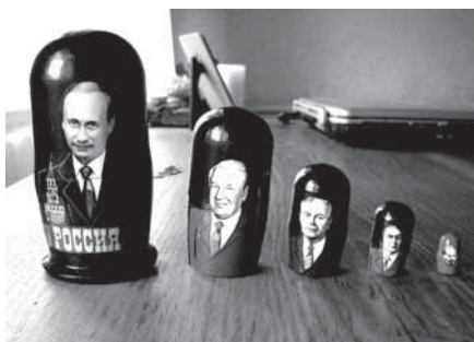
Vienas Maskvoje populiarių suvenyrų. Matrioškoje – penki Rusijos prezidentai: V.Putinas, B.Jelcinas, M.Gorbačiovas, L.Brežnevas, V.Leninas

Nižnij Novgorodo Kremliaus architektūros fragmentai šiek tiek primena Kauno pilį. Todėl, vaikščiodama po Nemuno ir Neris Santakos parką ir gėrėdamasi Kauno pilimi, vis prisimenu šią įsimintiną kelionę.