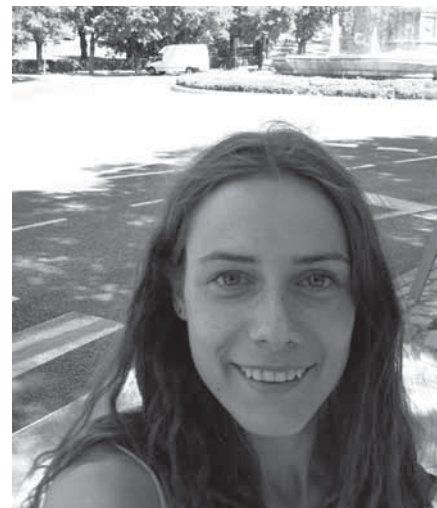
Greta labai greitai pamilo Ispaniją ir dabar tik ir svajoja apie tai, kaip galėtų čia grįžti

Gretos teigimu, ji ne tik parsivežė daugybę nuostabių įspūdžių, bet ir nepamiršo savo pagrindinio tikslo – patobulinti ispanų kalbos įgūdžius. Tai jai pavyko padaryti lankant intensyvų kursą, be to, šią kalbą ji girdėdavo visur – parduotuvėse, gatvėse, klubuose. Greta džiaugiasi ir patobulėjusiais savo anglų kalbos įgūdžiais, nes šios kalbos prireikė ne tik D.Britanijoje, bet ir Ispanijoje, bendraujant su buto draugais iš įvairių šalių: be jau minėtų šalių atstovų, kartu su ja bute gyveno ir australė, suomė, anglė bei vaikinai iš Madagaskaro.