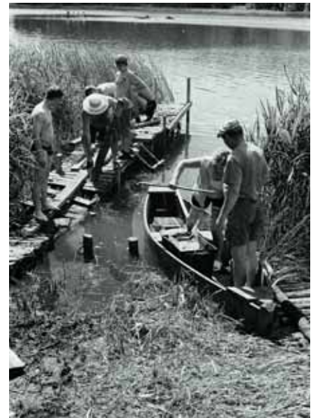
Kartu su jaunaisiais karatistais griovėme sutrešusį lieptelį bei rovėme švendres, o už pagalbą pakrantės sodybos šeimininkai leido maudytis kada panorėjus

Nutarėme nubėgti išsimaudyti į Veisiejų ežerą – geriausią vietą atsivėsinti ar tiesiog nusiplauti dulkes, vis limpančias prie kūno, su stovyklaujančiais vaikais ir jų tėvais pažaidus futbolą ar tinklinį. Stovykloje futbolas buvo vos ne svarbesnė sporto šaka nei karatė, nes kaip tik tuo metu vyko Europos fut-