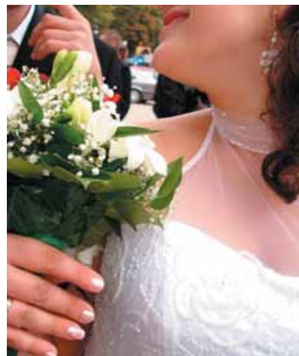
Vestuvės dažnai vadinamos laimingiausia gyvenime diena. Tačiau kartais jos būna kupinos streso ar netikėtų kuriozų