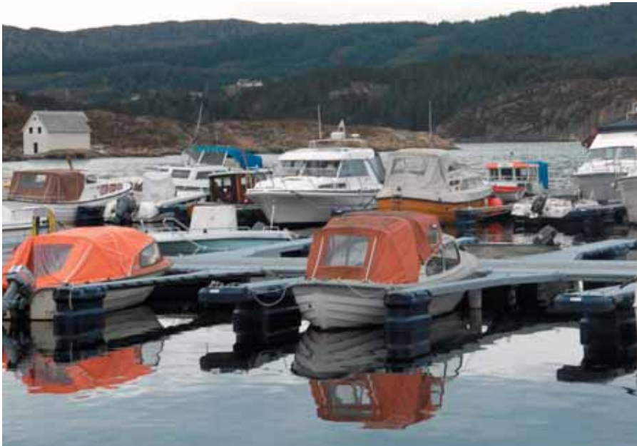
Norvegijoje gausu prieplaukų: daugelis norvegų turi po valtėlę, kuria plaukia į kitą šalį dirbti ar kitokiais reikalais