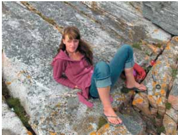
Norvegija – akmenimis nusėtas kraštas. Šalia fjordų nėra paplūdimių, todėl juos atstoja akmenuoti krantai

Gavau lietuvišką diplomą ir „nutekinau“ savo protą į Norvegiją, tiksliau – į kaimą prie Bergeno braškių skinti. Ne tu tikrų, bet šiaip gyvenimo braškių.