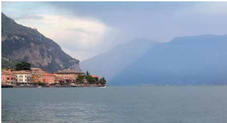
Gražiną sužavėjo nuostabaus grožio miestelis Garnjanas ir jo apylinkės

Po poros savaitių supratusi, kad kitaip nebus, išitraukiau į italų žaidimą „kalbėk su visais apie viską“ ir pati bet kurio gatvėje