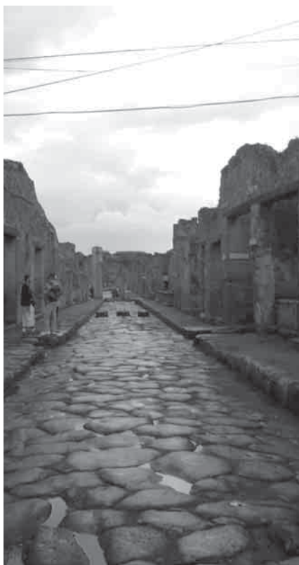
Pompėjoje jau mūsų eros pradžioje buvo išgrįstos gatvės ir įrengti šaligatviai