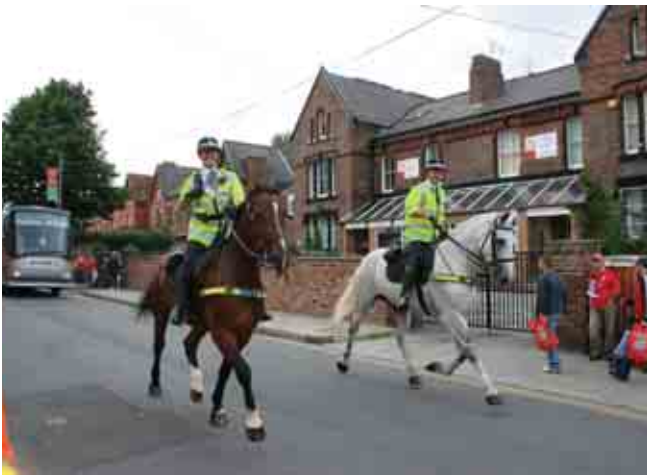
FBK „Kauno“ futbolininkų autobusą Liverpulio gatvėmis lydėjo raitoji policija

Rugpjūčio 1-ąją dieną charteriniu reišu iš Kauno, šį kartą be jokių gamtos išdaigų, nutūpėme Liverpulio oro uoste. Į