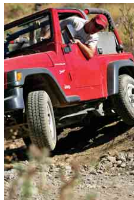
... ir galingus džipus