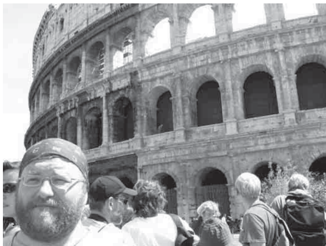
Prieš 2 tūkstančius metų pastatytas Koliziejus ir šiandien stebina savo didybe

Jūrų karalienės titulą kadaise turėjusi Venecija – ištis išskirtinis miestas. Siaurutėse gatvelėse daugybė parduotuvėlių, kuriose galima išgyti įvairių suvenyrų. Populiariausi jų – tradicinės Venecijos karnavalo kaukės. Nustebome pamatę kainas kavinėse, picerijose ir parduotu-