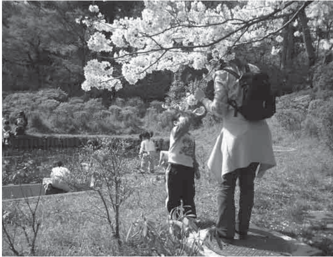
Japonai kasmet švenčia sakurų žydėjimo šventę Hanami

Be galo sunku vien žodžiais apibūdinti Tokijų. Jis modernus ir tradiciškas tuo pačiu metu. Užtenka paėjėti keletą