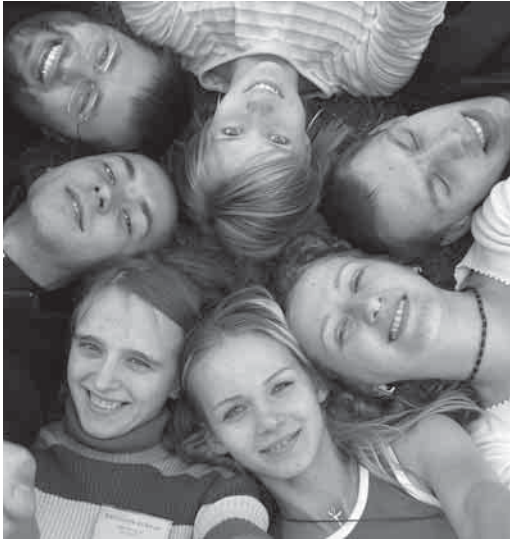
„Pauliaus kurso“ dalyviai nestokojo geros nuotaikos

Kaip žinia, taip atsitiko Pauliui, kuris iki šio atsitikimo vadinosi Sauliumi ir apie evangelizaciją net negalvojo. Birželio 18–30 dienomis Vilniuje, Trinapolio Kristaus Karaliaus seserų vienuolyno rekolekcijų namuose vyko Katalikų evangelizacijos centro parengtas „Pauliaus kursas“, skirtas Gerosios Naujienos – Evangelijos skelbėjui ruošimui. Po šio kurso, manau, visi dalyviai jautėsi panašiai kaip Paulius. Beveik kasdien vyko praktiniai-kūrybiniai darbai grupėse. Naudodamiesi XXI amžiaus pasiekimais ieškojome būdų kaip kalbėti apie tikėjimą šiuolaikiniam skubančiam žmogui. Pasirodo tai galima daryti paplūdimyje, muzikos mokykloje, vaikų darželyje, Joninių šventės metu ir net Seime... Sužinojome 12 skirtingų žadinimo būdų ir gimė idėja surengti konferenciją vyrams „Jėzus tau ne konkurentas“.