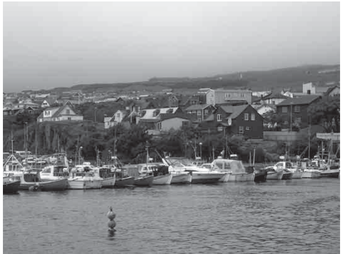
Farerų sostinė Toršaunas

Tačiau jau kitą dieną po laimėtų rungtynių prieš tylenius, visa tyla ir ramybė išgaravo – klube telefonas kaito nuo skambučių dėl bilietų į rungtynes. Norinčių buvo iš visur – Latvijos, Suomijos, Lenkijos, Austrijos ir t.t. Elektroninio pašto dėžutė lūžinėjo nuo laiškų su prašymais akredituoti žurnalistus į rungtynes Kaune. Vokietijos, Rusijos, Lenkijos, Estijos, Latvijos ir kitų šalių leidinių atstovai važiavo čia net be didelių garantijų, kad pateks į stadioną.