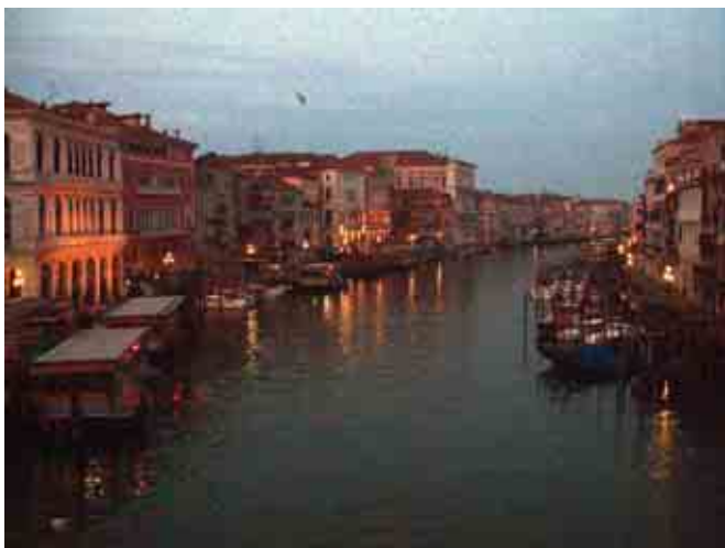
Bundanti rytinė Venecija

Iš tiesų šioje kelionėje pamatėme, sužinojome ir išmokome labai daug. Italijoje ir Austrijoje patirtus išpūdžius vainikavo kartu keliavusių žmonių nuoširdumo ir aplankytose vietose plevenusios ypatingos auros sukurta išskirtinė atmosfera, lydėjusi mus visos kelionės metu.