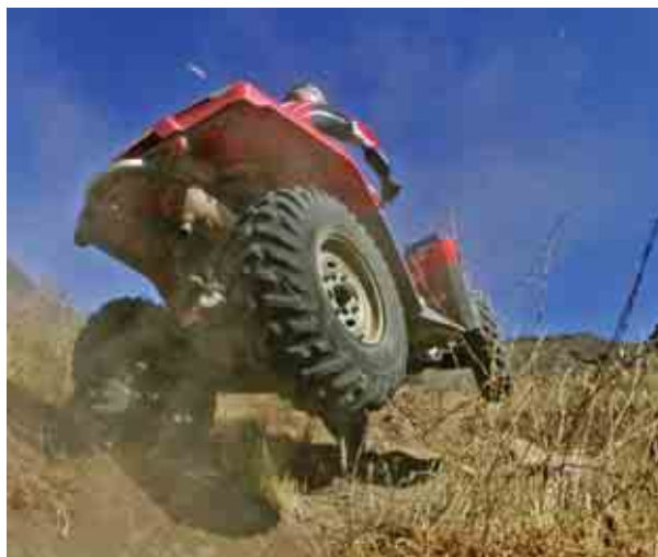
Kanaruose Gediminas išbandė keturračius ATV motociklus...

kiojo valtimis, lipo į stačius kaip siena skardžius. Tarp dviejų uolų ištemptu 100 metrų ilgio lynu specialia įranga reikėjo pervažiuoti nuo vieno krašto iki kito. Daugelis užduočių reikalavo nemažai fizinių jėgų, o kai kurios merginos net nesugebėdavo jų įveikti. Nemažai jėgų atimdavo ir nuolat tvyrantis didžiulis