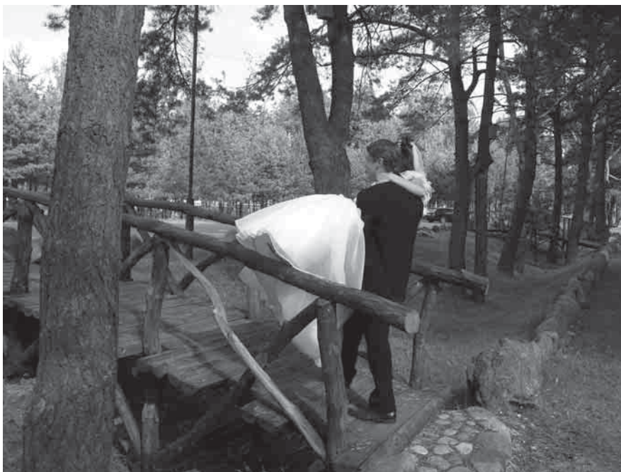
Jaunikis turi pernešti nuotaką per tiltą

Labai svarbu, kad jaunieji savo šventės metu neužmirštų padėkoti tėveliams ir įteiktų jiems mažas dovanėles. Tėveliai savo ruožtu jauniems perduoda simbolinį šeimos židinį. Vidurnaktį tradiciškai visi kelia šampano taures ir, žinoma, šventę vainikuoja jau įpročiu tapusiais fejerverkais. Vestuvių puotos metu piršliai gali pasiūlyti įvairiausių žaidimų, pavyzdžiui, kad jauniems vėliau būtų lengviau vaikučiams vardus sugalvoti, svečiai ant vaikiškų marškinėlių turi surašyti siūlomus vardus, burtų keliu gali būti