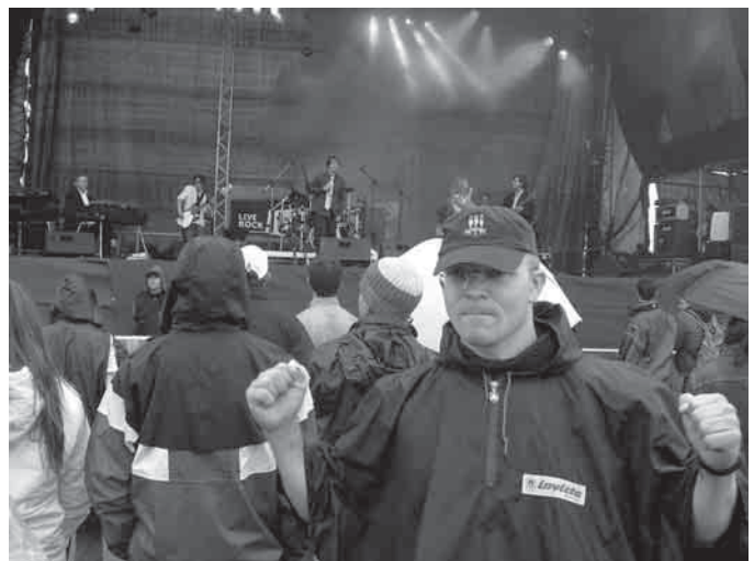
Kiolne vyko daug koncertų

Lietuvos jaunimui atmintin įstrigo vienas nepakartojamas vaizdas, matytas