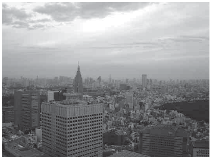
Neaprepiamos Tokijo betono džiunglės

Studijuojant, keliaujant po Japoniją metai prabėgo ypač greitai. Per tą laikotarpį Tekančios saulės šalis buvo virtusi mano namais, kuriuose nesijaučiau sve-