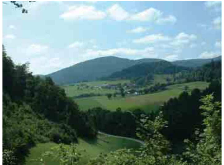
Piligrimus sužavėjo Austrijos kalnai

tūra vos perkopė per 20 laipsnių šilumos. Tik Romoje porą dienų teko pakentėti apie 30 laipsnių karštį.