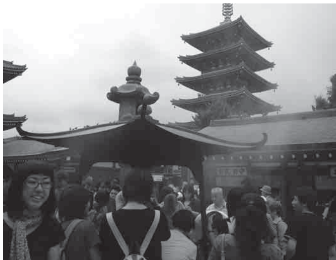
Tokijas – kontrastų miestas. Tarp dangoraižių – nemažai senovinių šventyklų

Šibuja – tai ekstravagantiškos mados centras. Ne kartą buvau priblokštas sutikęs čia netikėčiausiai apsirengusių žmonių. Apsmukusios kelnės, išbalinti plaukai ar soliariume įdegęs veidas yra menkniekis. Šiame rajone galima pastebėti paauglių, vilkinčių pandos ar beždžionės kostiumus. Netoli Šibujos centro esantis Haradžiuuku (Harajuku) sutraukia minias užsienio turistų ne