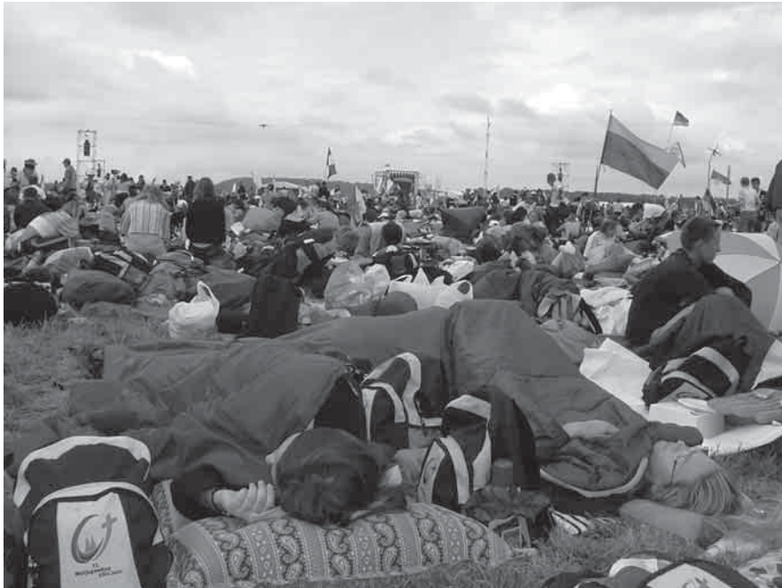
Jaunimas miegojo po atviru dangumi

Nemažai mūsų universiteto studentų dalyvavo rugpjūčio mėnesį vykusiose Pasaulio jaunimo dienose Vokietijoje esančiame Kiolno mieste. Čia susirinko apie 1 milijonas jaunų žmonių iš viso pasaulio, tarp jų buvo ir 2500 lietuvių. Pateikiame mūsų universiteto studentų įspūdžius iš šio svarbaus ir įdomaus renginio jaunimui.