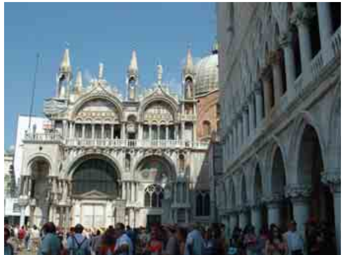
Šv. Morkaus aikštė išsiskiria puošniais pastatais