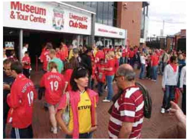
Raudonieji Liverpoolio fanai apgulę savo klubo suvenyrų parduotuvę

Per kelias savaites iš pačios provincijos atsidūrėme futbolo širdyje arba iš futbolo akmens amžiaus patekome į Raudonieji Liverpoolio fanai apgulę savo klubo suvenyrų parduotuvę