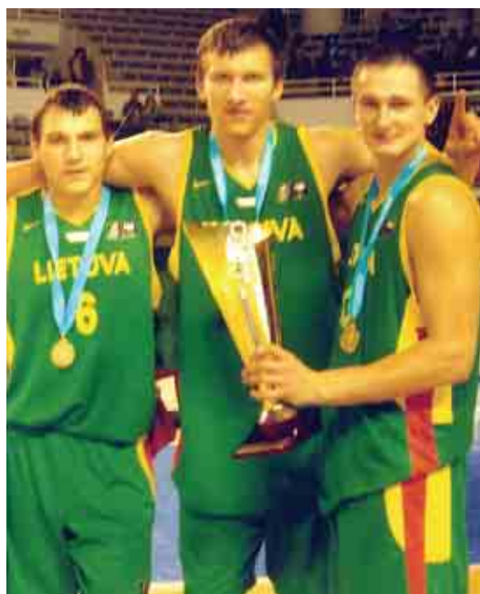
VDU studentų desantas Pasaulio jaunimo čempionų komandoje. Iš kairės: Jonas Mačiulis, Darius Šilinskis ir Paulius Jankūnas

Rusai niekada negarsėjo kaip puikūs organizatoriai. Kaip buvo surengtas šis čempionatas?