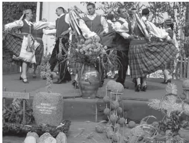
Žolinės šventės akimirka. Apačioje matyti Derlinių vainikai

Rytojaus dieną apžiūriu modernų Alicijos tėvų ūkį – jis didžiulis, kaip ir kiti aplinkiniai ūkiai. Dauguma punskiečių yra įsikūrę vienkiemiuose, išsibarsčiusiuose tarp daugybės kalvelių bei ežerų, ir vėrciasi