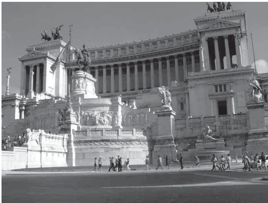
XIX a. pabaigoje pastatytas Tėvynės altorius skirtas Italijos suvienijimui

Tą pačią dieną dar užsukome į Orvieto miestą, taip pat įsikūrusi ant sta-