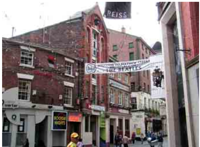
Liverpulius – legendinių „Bitlų“ miestas

Anglai laimėjo 2:0 ir toliau gina savo titulą. Žaidėjai, aptarnaujantis personalas, ir svarbiausia – sirgaliai, visi jie – profesionalai. Nuoširdūs ir pamišę. Ir kitokie netaps, kol stadione susikabinę rankomis trauks „You'll never walk alone“.