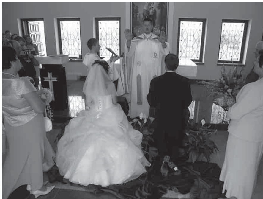
Daugelis porų dabar tuokiasi tik bažnyčioje

Šią vasarą atrodė, kad aplinkui tuokiasi visi draugai ir pažįstami – buvau pakviesta net į šešias vestuvių puotas! Šią vasarą ištekėjo net vienuolika mūsų universitete besimokančių man pažįstamų merginų, o kur dar tos, apie kurias nieko nežinau?... Kas tai, mada ar kokių nors planetų astrologinio išsidėstymo įtaka? „Ši vasara kažkokia ypatinga: nuo birželio pradžios iki pat spalio pabaigos užsakyti visi savaitgaliai“, – apgailestaudami sakė ne tik sodybų savininkai, bet ir vestuvių muzikantai. Taigi, remdamasi savo įspūdziais, patirtais linksminantis vestuvėse, pamėginau apibendrinti juos.