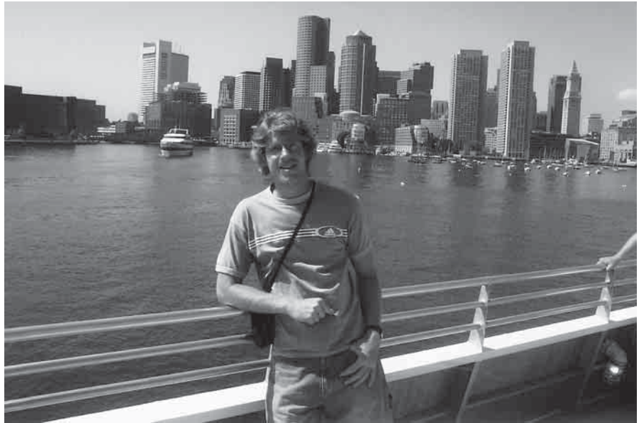
Aurelijus nusifotografavo Bostono dangoraižių fone

Čia žmonės atvažiuoja pailsėti netgi žiemą. Jie gyvena specialiuose namukuose, o nuobodžiauti jiems neleidžia gausybė vandens pramogų: čia