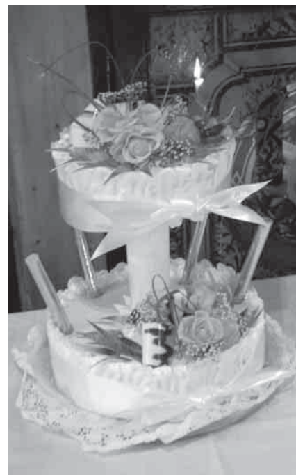
Įmantrus tortas – būtinas vestuvių atributas

Atminkite, tai jūsų šventė, todėl niekas negali patarti, kokia ji turi būti.